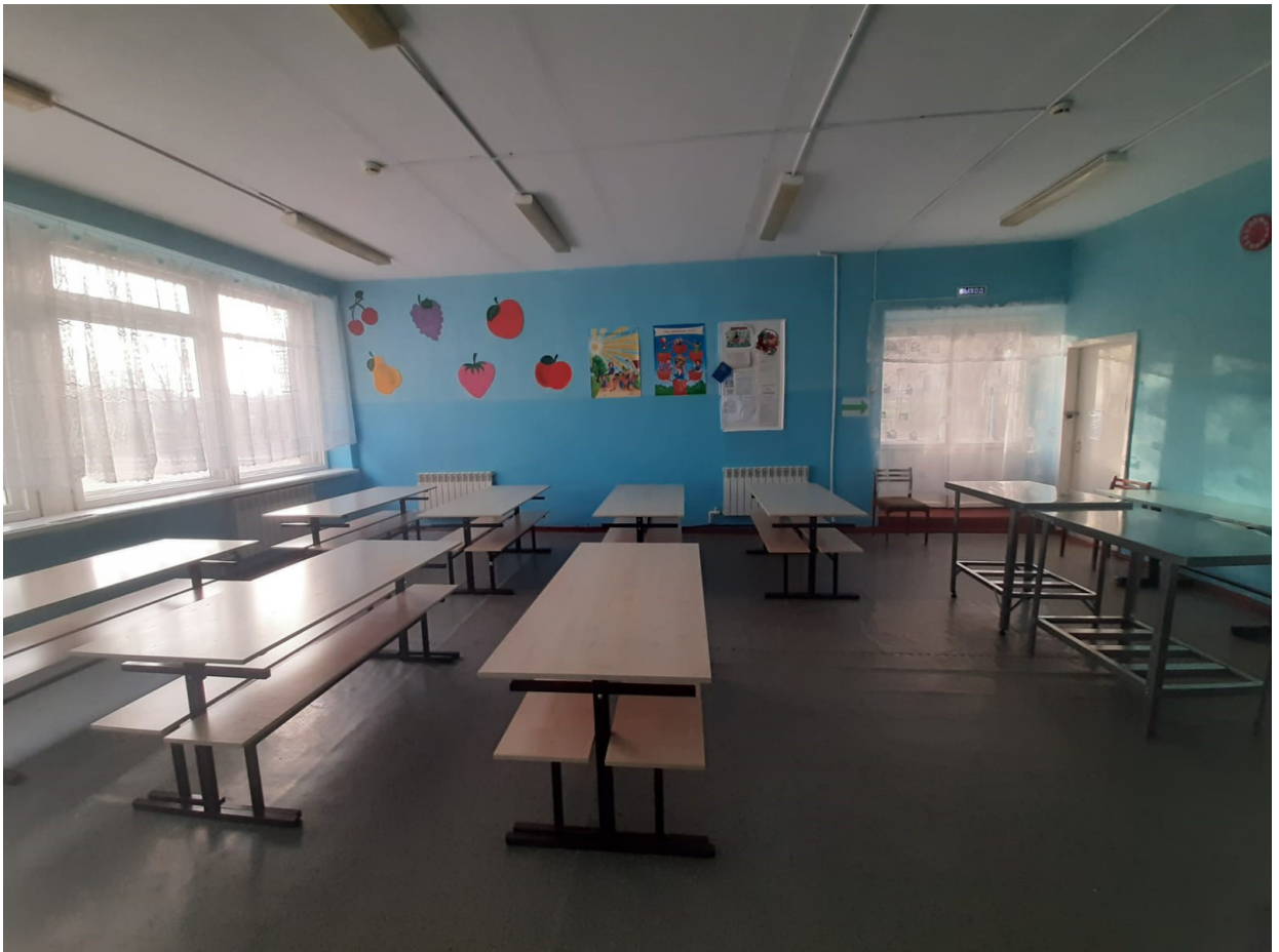
Фото школьной столовой (состояние объекта «До»)